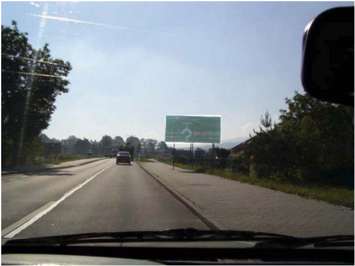
Hier links abbiegen: